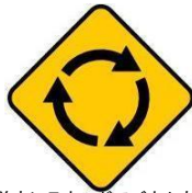
前方にラウンドアバウト有り