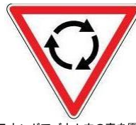
ラウンドアバウト内の車を優先